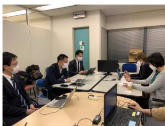
プロジェクト会議の様子