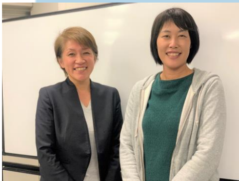
※撮影時のみマスクを外しています。

高齢者とスポーツ関係事業者の双方から、行きたい・来てほしいという声があり、お互いが必要としているのにその機会を失ってしまっているように感じます。オンラインによる運動教室がコロナ禍におけるひとつの解決手法になるのではと考えています。