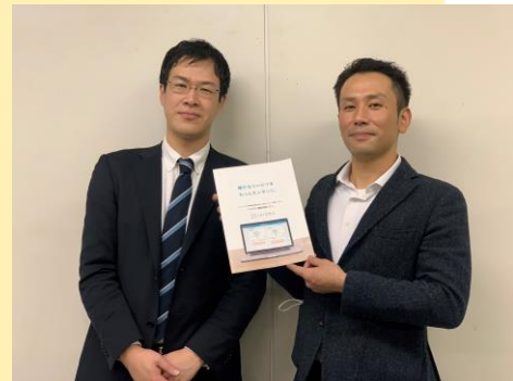
※撮影時のみマスクを外しています。

コロナ禍による外出自粛で運動不足気味の方も多いのではないでしょうか。私たちの「リハブコール」は、運動を指導する側の先生と、離れた場所にいる利用者のみなさんをテレビ電話のようにつなぎますので、感染リスクもなく、安全に運動不足を解消することができます。新しい時代の「オンライン運動教室」で、お年寄りのフレイル予防に貢献したいと考えています。